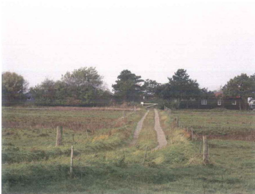
Foto nr. 80 – Bagvejen ud fra stikvej mellem Hybenvej 13 og 15 set mod vest. Foto 84. Hegn i bagskel, vistnok ud for Hybenvej 15.

mellem Hybenvej 13 og 15 eller eventuelt vejen fra Lodshusvej til SEAS-kolonien lidt længere sydpå kunne hæves til en dæmning, der forhindrer bagindløb.