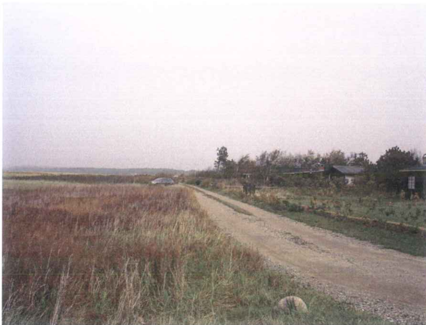
Foto nr. 83 – Strandvænget ligger foran husene. Dige ud på V-side af vejen.

Kortet på næste side viser GRF-SØ-området med indsat strandbeskyttelseslinje. Man kan på Miljøportalen finde flere oplysninger, bl.a. om naturbeskyttelse, § 3 og Natura 2000.